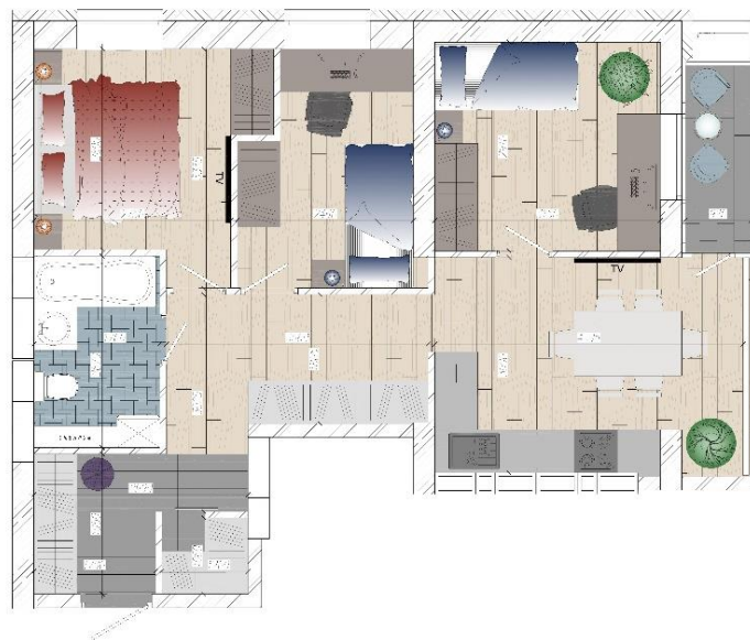
Когда появился ребенок