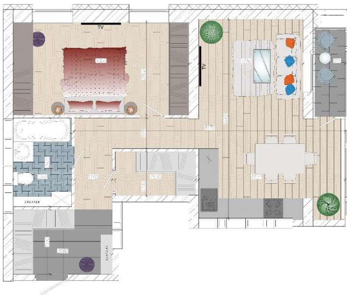
Ваша первая квартира