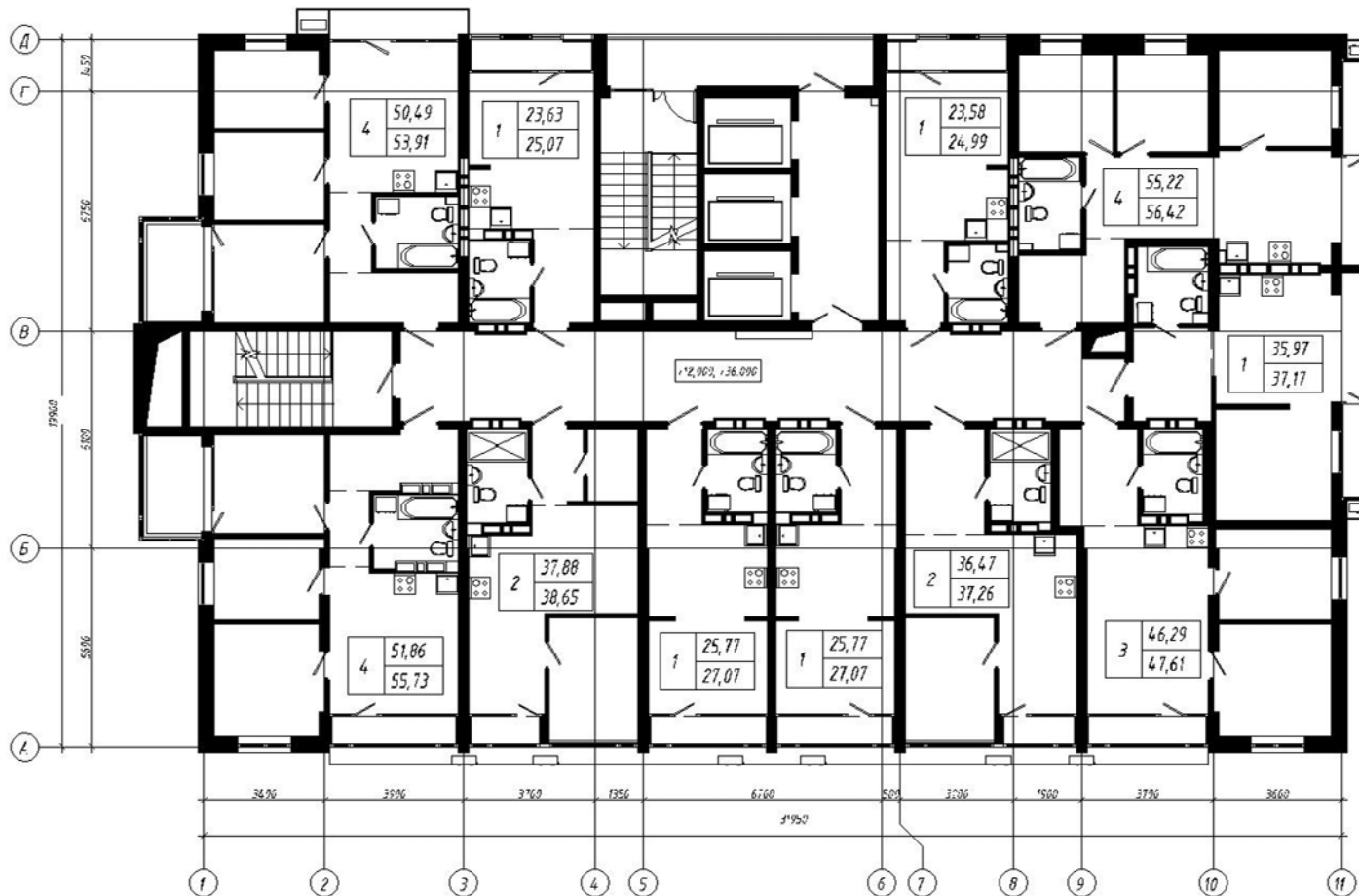
План этажа на отметке _____

к Договору участия в долевом строительстве многоквартирного дома № - - от . . .20 . г.